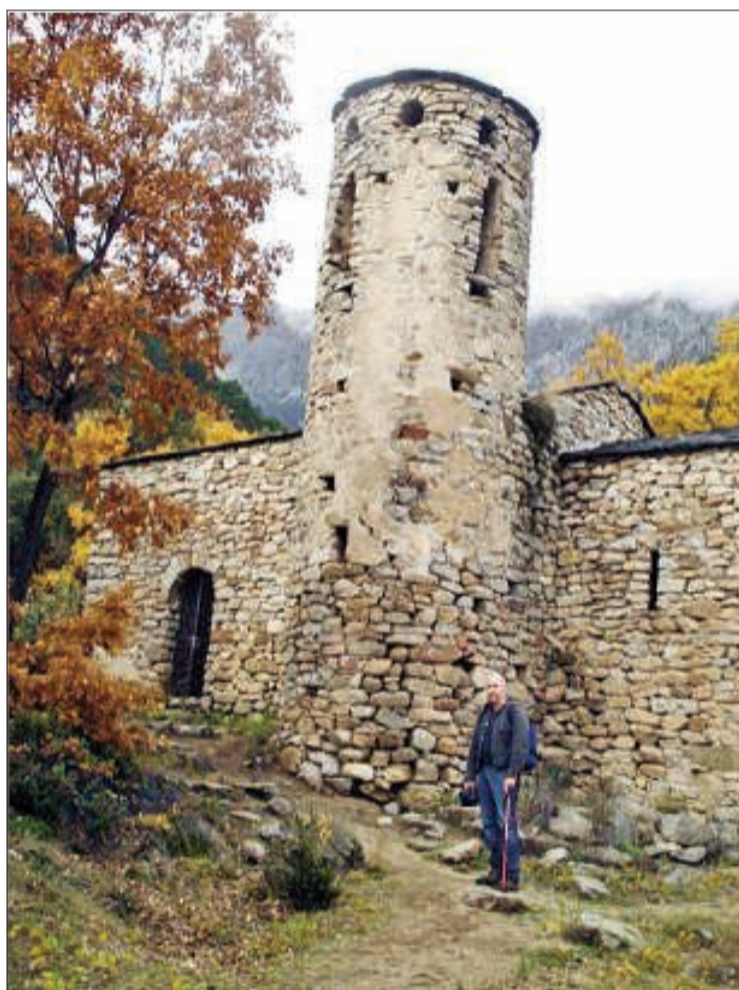
La fotografia és del 2012, amb les esquerdes sobre les quals no es va actuar fins al 2017.