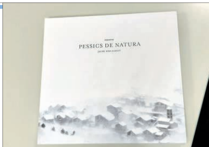
Portada del llibre que proposa Riba enguany.

■ ANDORRA LA VELLA. Jaume Riba torna a comparèixer a les llibreries a partir d'avui amb un nou llibre de fotografies, Pessics de natura . El volum presenta un nou recorregut pels paratges naturals i el patrimoni historicoartístic del país. En aquest cas, però, Riba s'atreveix a fer un pas endavant i endinsar-se en algunes de les imatges en composicions molt més abstractes.