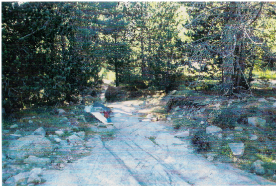
Fig. 1: Roc de l'Estall. El sòcol granític apareix polit i estriat per l'acció de la glacera. Situació del pedió n°2 (1820 m), classificat com un Podsol (FAO, 1990). A la seva base s'hi ha trobat un dipòsit d'escàs gruix, compacte i de textura franco-llimosa, d'un till subglacial

Per a la cartografia es va procedir a la descripció de 38 pedions entre el coll de Vallcivera i Entremesaigües, incloent els sectors de l'Illa, els Estanys Forcats, l'Estany Blau i els circs de l'Estall Serrer - Setut. La memòria de la cartografia està basada per la identificació d'un total de 48 mostres de sòls recollides a l'agost de 1997. D'aquest total s'han efectuat analítiques, granulometries i determinacions que han permès classificar un total de 21 pedions. En base als pedions, la fotointerpretació, la geomorfologia, el règim tèrmic de la vall i la vegetació existent s'ha pogut completar la cartografia de la vall principal.