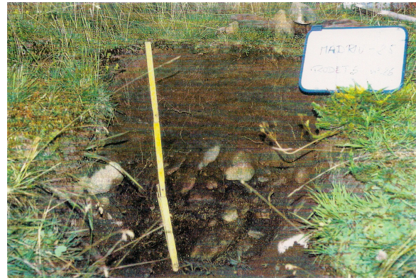
Fig. 3: Pedió n°25 al Pla de l'Inгла (2180 m), classificat com un Fluvisol dístric

Aquesta experiència acumulada és útil en el moment d'avaluar la capacitat dels sòls d'un paratge natural a Andorra pel segrest del CO 2 atmosfèric. Es planteja aquí la possibilitat de selecció de certes localitats estudiades per establir una xarxa de monitoreig que permeti observar l'evolució del contingut de carboni en el sòl.