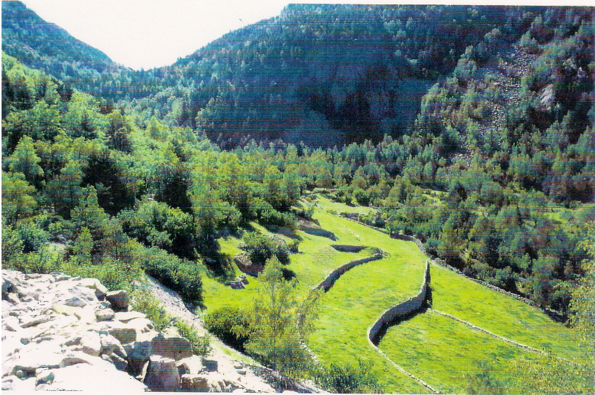
Prats de dall de Ràmio. L'escarpada Obaga del Bony resta a l'ombra, la major part de l'any segons el mapa de radiació solar efectuats prèviament a l'estudi dels sòls.

La vall del Madriu constitueix un dels espais de major atractiu del Principat d'Andorra. S'estén al llarg d'un gradient altitudinal de gairebé 2000 metres, fet que propicia la presència d'una notable diversitat d'hàbitats. S'hi aprecia un relleu d'origen típicament glacial. En aquest entorn, un cop començaren les geleres a retrocedir, s'ha anat acumulant materials erosionats, sotmesos a processos d'edafització fins generar les actuals cobertores edàfiques. S'hi troben extensos boscos, des dels propis de l'estatge muntà amb caducifolis i pi roig fins a les avetoses i pinedes de pi negre de l'estatge subalpí, deixant pas en altitud als prats alpins i aquests als roquissars i crestalls exposats. Els sòls del Madriu corresponen majoritàriament a Regosòls i Leptosòls (Cartografia de sòls de la vall del Madriu (Palomar et al. , 2011) amb gruixos febles en altitud i majors a les zones de més gran acumulació als fons de vall.