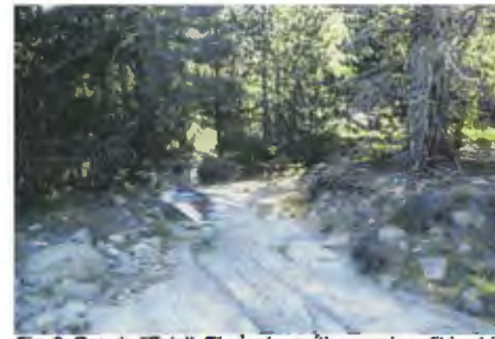
Fig. 2: Roc de l'Estall. El sòcol granític apareix polit i estriat per l'acció de la glacera. Situació del pedió n°2 (1820 m), classificat com un Podsòl (FAO, 1990). A la seva base s'hi ha trobat un dipòsit d'escòs gruix, compacte i de textura franco-limosa, d'un till subglacial.

El pedió n°2 (Roc de l'Estall, 1820 m) ha estat classificat com un podsòl, on l'horitzó Bh s'acumulació de matèria orgànica i ferro s'hauria desenvolupat per la translocació de complexos organometàl·lics constituïts per ferro i els compostos de la fracció més àcida de l'humus.