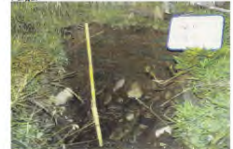
Fig. 3: Pedió n°25 al Pla de l'Inglia (2180 m), classificat com un Fluvisòl dístic.

D'acord amb les definicions de la llegenda de la versió en castellà del mapa mundial de sòls de la FAO a la vall del Madriu estan majoritàriament representats els grups dels Regosòls i dels Leptosòls. També hi són, encara que ocupant superfícies molt inferiors, els Fluvisòls així com els Histosòls i Gleysòls. Sobre els dipòsits d'origen glacial i periglacial, així com sobre els dipòsits de vessant, es desenvolupen generalment Regosòls dístics i úmbrics. On el sòcol granític resta al descobert s'hi dona la presència predominant de Leptosòls dístics i lítics. Els Fluvisòls dístics i úmbrics ocupen principalment aquells trams del fons de la vall en que és important la dinàmica al·luvial, produint-se freqüents aportacions de nous sediments durant les crescudes. Histosòls i/o Gleysòls ocupen les planes mal drenades del fons dels circs i de la vall del corrent principal. Cal esmentar finalment la presència puntual d'Antrosòls úrbics a l'Estall Serrer, desenvolupats a partir de restes d'antigues carboneres que podrien haver proveït de combustible la propera Farga d'Andorra situada al Pla de la Farga.