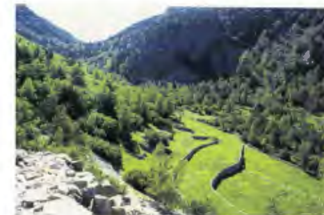
Fig 1: Prats de dall de Ràmio. L'escarpada Obaga del Bony resta a l'ombra la major part de l'any segons el mapa de radiació solar efectuat prèviament a l'estudi dels sòls.

i les allaus han desencadenat diverses esllavissades del sector de Gargantillar. En la capçalera (Port de Vall Civera) els processos d'incisió i d'erosió remuntant són producte dels fluxos que resulten de la fosa del mantell nival (Gómez, 1990). Petites esllavissades d'origen incert situades en àrees poc inclinades i al peu de relleus més o menys abruptes han estat observades puntualment a l'est de l'Estany Forcat i al sud de l'Estany de l'Illa. A la Costa Verda i a La Muga s'observa una inestabilitat dels vessants generalitzada, la qual es manifesta en forma d'esllavissades i altres morfologies de detall.